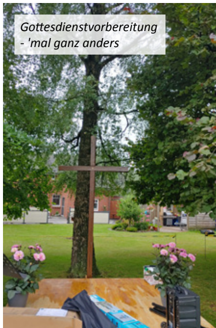
Gottesdienstvorbereitung - 'mal ganz anders

Mit der Sommerkirchen-Tour 2020 gab es aber etwas, was es vorher noch nicht gab: eine gemeinsame Gottesdienstreihe während der Sommerferien.